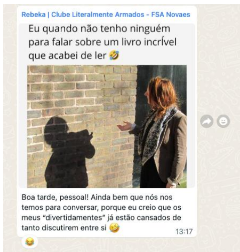
Figura 5 - Publicação da mediadora sobre sociabilidade literária em ambiente digital