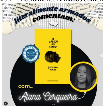
Figura 2 - "Literalmente Armados Comentam"